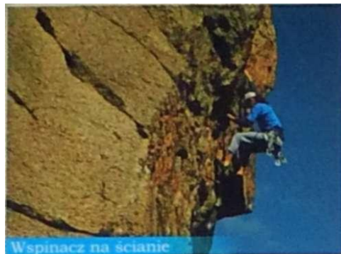
Wspinacz na ścianie

Porozrzucane na całym terenie Rudaw Janowickich skalne turnie budziły zainteresowanie okolicznej ludności już w XVIII wieku. Wiele z nich zostało zagospodarowanych turystycznie poprzez włączenie ich w popularne i modne w tamtych czasach parki krajobrazowe. Początki udokumentowanej działalności wspinaczkowej sięgają lat 30-tych XX stulecia.