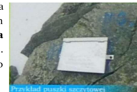
Przykład puszek szczytowych

Bardzo ciekawym zwyczajem okresu przedwojennego było umieszczanie na niektórych wierzchołkach książek szczytowych w specjalnie przygotowanych metalowych puszkach. We wnętrzu znajdowała się kartka i ołówek by można było zostawić informację o kolejnych wejściach na dany wierzchołek. Bywało, że wspinacze dopisywali swoje odczucia po zdobyciu wierzchołka. Trudno ustalić kiedy zostały założone i dlaczego po roku 1945 nagle zniknęły.