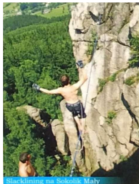
Slacklining na Sokolik Mały

Jeszcze przed II Wojną Światową na szczyt Sokolika Małego można było dostać się po kładce łączącej obydwie szczyty. Nie wiadomo dokładnie, kto zbudował kładkę i jakie były motywy jego działania. Obecnie na drugi szczyt można dostać się jedynie drogami wspinaczkowymi lub podczas odbywających się raz w roku zawodów chodzenia na linie rozciągniętej między dwoma szczytami, tzw. slacklining.